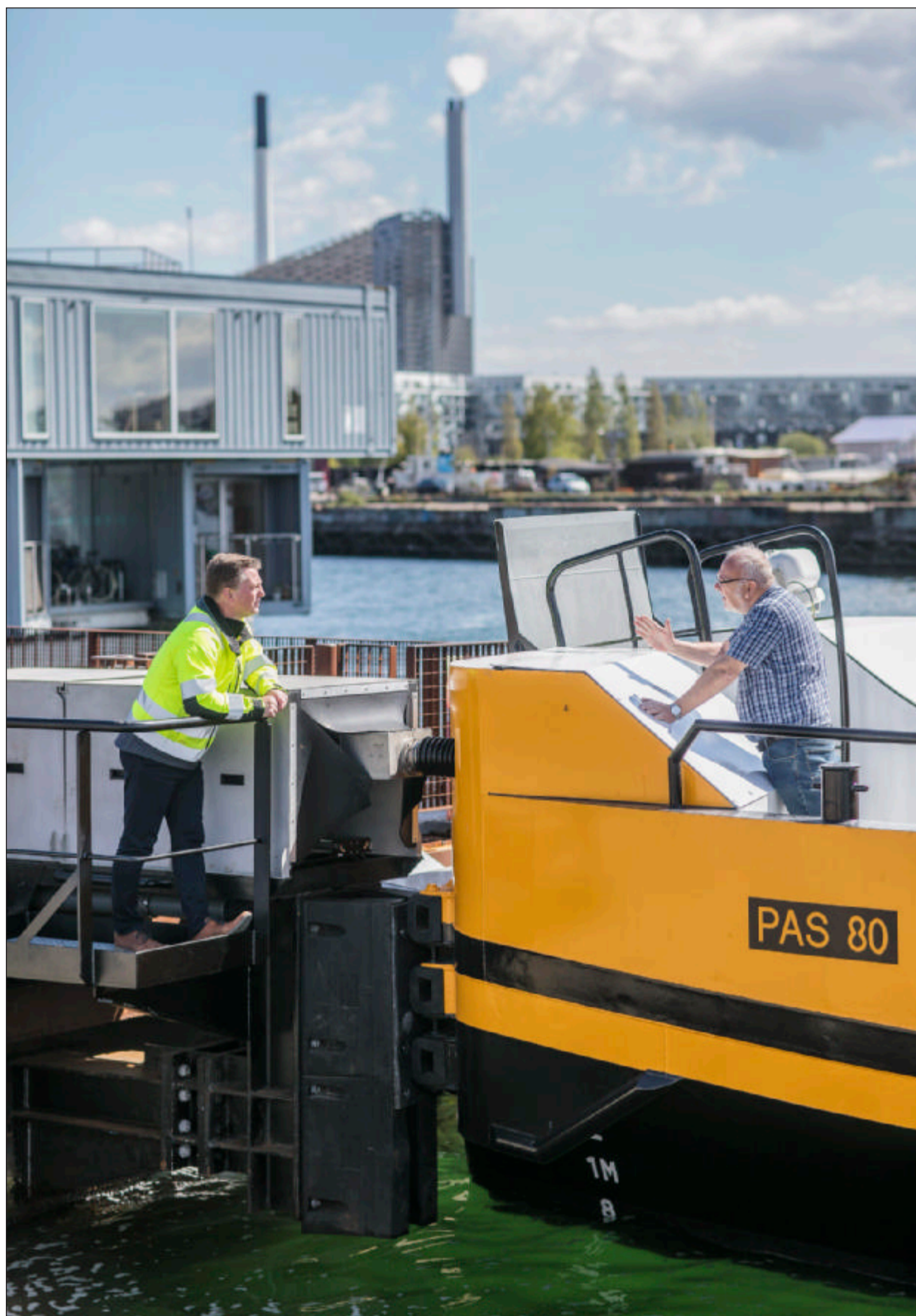
De københavnske vandbusser lynlades hver gang, de er fremme ved en endestation.