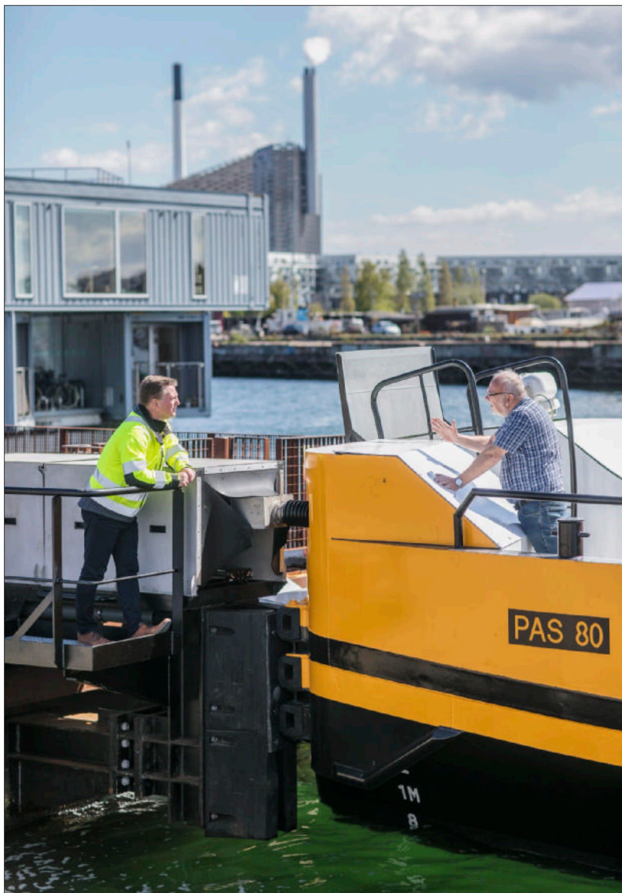
De københavnske vandbusser lynlades hver gang, de er fremme ved en endestation.